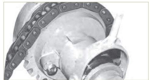
(단위 UNIT : mm)

This is power transmission chain that is designed and adopted carefully selected material to treat wastewater properly. Stainless steel has adapted to enhance corrosion resistance and proper heat treatment for all parts has applied to enhance strength. The dimensions (pitch, bush diameter, inner width of bush link) are same as standard roller chain enabling to standard sprocket as adopting bushed chain type for convenient application.